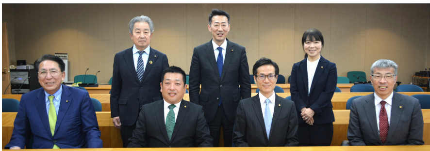
文教福祉常任委員会のメンバー

文教福祉常任委員会 副委員長 広報公聴委員会 委員 予算常任委員会 委員 決算常任委員会 委員